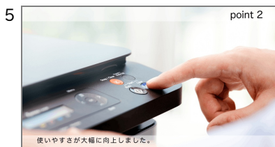
5 特長2-2 先ほどのカットに続ける形で、特長2をさらに説明します。