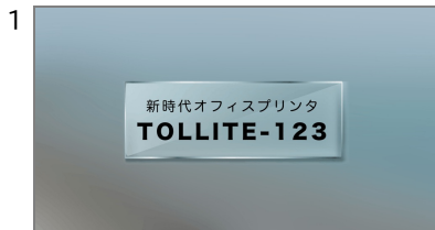
1 タイトル タイトルを表示します。