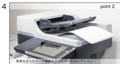
4 特長2-1 商品の第2の特長を説明します。