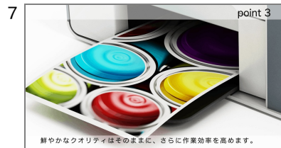
7 特長3-2 先ほどのカットに続ける形で、特長3をさらに説明します。