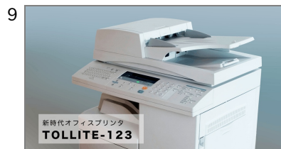
9 ディスプレイ 商品のメインカットと、商品名を表示します。