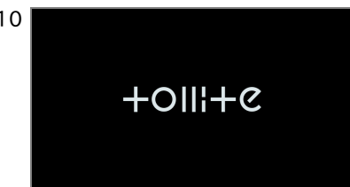
10 ロゴ 商品ロゴ、企業ロゴを表示します。