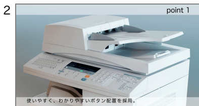
2 特長1-1 商品の第1の特長を説明します。