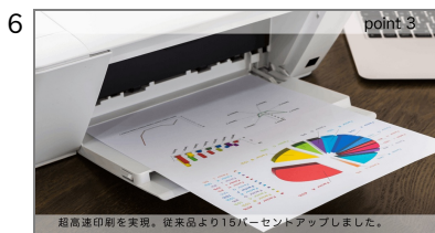
6 特長3-1 商品の第3の特長を説明します。