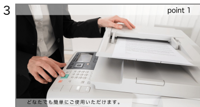
3 特長1-2 先ほどのカットに続ける形で、特長1をさらに説明します。